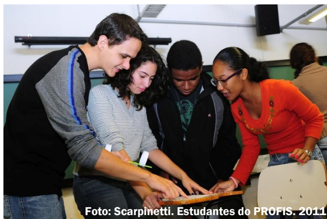
Estudantes do PROFIS. 2011

O Prêmio de Reconhecimento Acadêmico em Direitos humanos Unicamp – Instituto Vladimir Herzog se soma, a partir de agora, a outras premiações anualmente realizadas pela Unicamp. Porém, ao estimular a construção de compromissos cada vez maiores entre a pesquisa acadêmica e a dignidade da vida, pretende ir além dos efeitos para cada campo do conhecimento nas três universidades abarcadas por ele, reconhecendo a importância inconteste dos saberes para a sociedade. O convênio com o Instituto Vladimir Herzog, cujo trabalho em favor dos direitos humanos conta com consolidada importância social, e a ampliação para outras universidades públicas do estado reforçam esses objetivos.