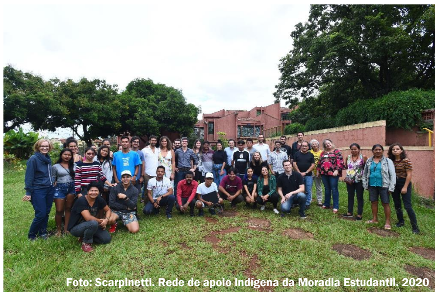
Rede de apoio indígena da Moradia Estudantil. 2020

Elaboração, ainda em andamento, de um plano de objetivos para a inclusão dos estudantes indígenas na Unicamp no horizonte dos próximos 10 anos.