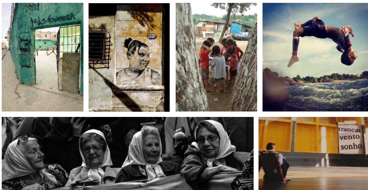
Fotos vencedoras dos Concursos de Fotografia “Como eu vejo os Direitos Humanos”

Link para a exposição 2020: http://143.106.227.166/museuav/index.php/como-eu-vejo-os-direitos-humanos/